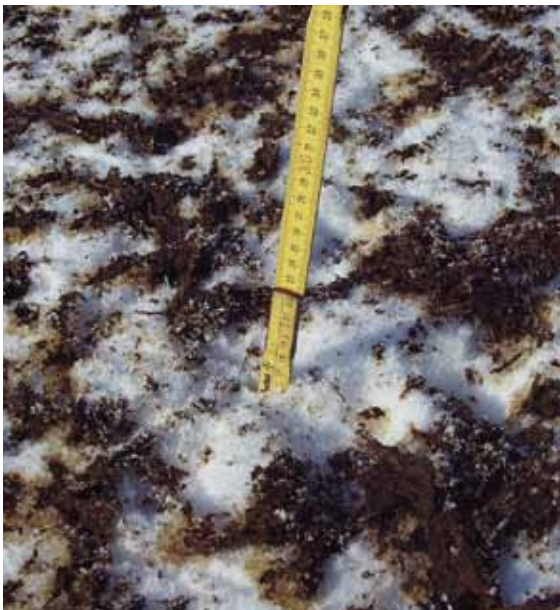
Über die Düngungsverbotszeiträume für N-haltige Dünger hinaus ist eine Ausbringung auch bei geschlossener Schneedecke (größer 5 cm, an 10 Stellen gemessen) und bei gefrorenem und/oder wassergesättigtem Boden untersagt.

Grundsätzlich erhebt sich die Frage, warum bei der Gülledüngung am 10. Oktober im neunjährigen Durchschnitt mit 39 dt/TM/ha der geringste Ertrag erzielt wurde. Dies ist insofern erklärbar, weil Anfang Oktober noch höhere Bodentemperaturen vorherrschen. Damit wird Ammonium-N der Gülle in Nitrat umgewandelt, welches im Gegensatz zu Ammonium der Auswaschung unterliegt.