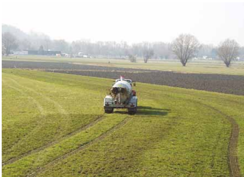
Durch starre Ausbringungsverbote sind Landwirte gezwungen, auch bei ungünstigen Bedingungen Wirtschaftsdünger auszubringen. Tiefe Fahrspuren und Bodenverdichtung sind die Folgen.