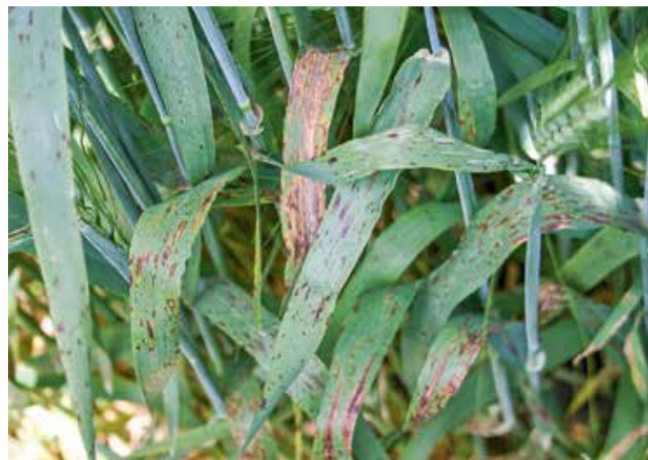
Ein Risikofaktor für die Übertragung von Ramularia ist das Saatgut.

Eine frühe Fungizidmaßnahme ist üblicherweise empfehlens-