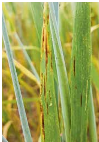
Netzflecken breiten sich vor allem von befallenen Ernterückständen oder Nachbarflächen her aus.

Bereits 2013 wurden erste Wirkungsverluste von Carboxamiden gegenüber Netzflecken festgestellt, weshalb sie bei Bedarf nur einmal während der Saison verwendet werden sollten. Cyprodinil und Prothioconazol bilden die Basis der Bekämpfung (zum Beispiel Unix Pro). Pyraclostrobin, zum Beispiel enthalten in Balaya, oder Trifloxystrobin, zum Beispiel enthalten in Delaro Forte, sind bei starkem Befall empfehlenswert.