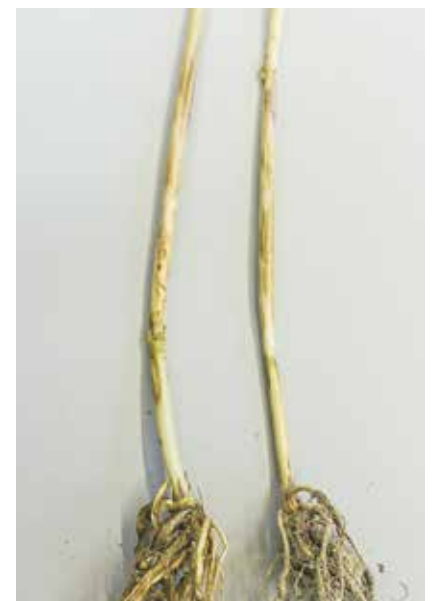
Halmbruch kann neben Winterweizen auch Roggen und Triticale befallen.

Das Modell kann aber nicht die Witterung der weiteren Vegetation vorhersagen. Das heißt, der Erreger kann bis BBCH 32 infizieren, die Möglichkeit besteht aber, dass durch folgende Trockenphasen der Erreger nicht weiterwächst und eine Infektion keinen Einfluss auf den Ertrag haben muss.