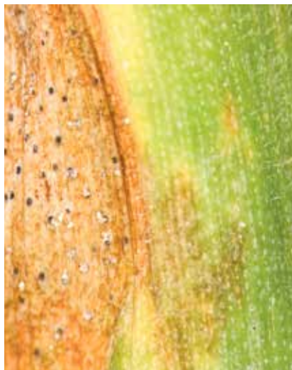
Septoria benötigt zur Ausbreitung Temperaturen von 15 bis 25 °C bei einer Blattnässe von 24 bis 48 Stunden.