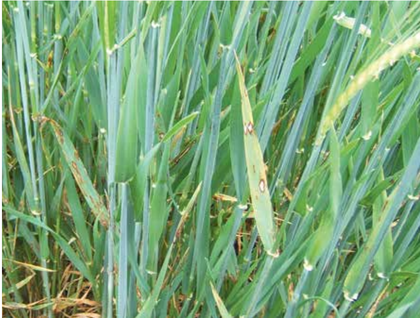
Der Befall mit Pilzkrankheiten – hier Rhynchosporium – kann zu erheblichen Ertragsausfällen führen. Im Frühjahr gilt es, Gegenmaßnahmen zu ergreifen.

Nach dem herausfordernden Krankheitsdruck von Pilzen im Jahr 2024 wurde erneut bei einigen Pilzkrankheiten, die übers Saatgut übertragen werden, damit gerechnet, dass auch im Jahr 2025 ein hoher Befallsdruck herrscht. Dies war durch die starke Trockenphase in den Monaten März und April nicht der Fall. Der aktuelle Winter war relativ trocken, ob sich das beim Befallsgeschehen widerspiegelt, bleibt abzuwarten.