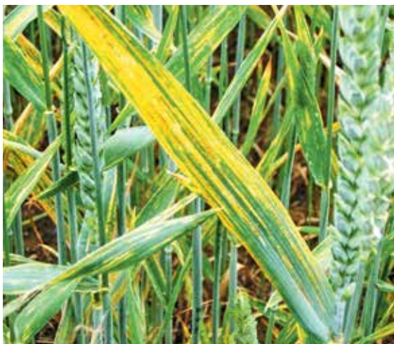
Gelbrost überlebt Temperaturen unter dem Gefrierpunkt, hohe Temperaturen und trockenes, sonniges Wetter aber nur selten.

Um eine dauerhafte Wirkung zu gewährleisten, kann Univoq durch die Mischung aus Fenpicoxamid und Prothioconazol als sehr potentes Mittel in BBCH 41-69 genutzt werden. Fenpicoxamid hat den Vorteil, dass der Erreger bisher gegen den Wirkstoff noch keine Resistenzen entwickelt hat. Um dies aufrecht zu erhalten, sollte ein Wirkstoffwechsel regelmäßig erfolgen. Zudem sind Kontaktwirkstoffe wie Folpan 500 SC geeignete Mischpartner. Auch Azole in Kombination mit Fluxapyroxad in zum Beispiel Revytrex (mit Mefentrifluconazol) oder im Avastel Pack (mit Prothioconazol) oder Bixafen in beispielsweise Ascra Xpro sind Pflan-