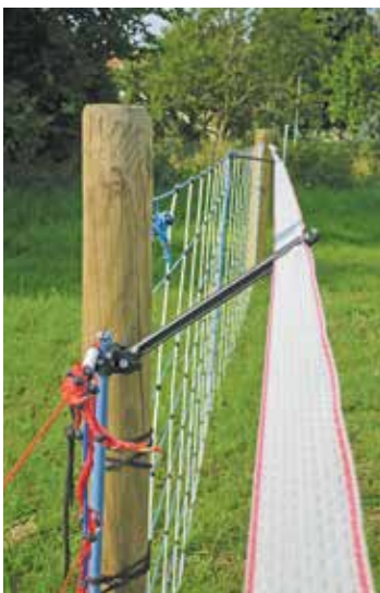
Viele Weidezäune im Bestand können durch Zusatzausrüstungen in ihrer wolfsabweisenden Wirkung verbessert werden. Es sind neue Vorbauisolatoren, die an geeignete Mobilzaunpfähle von ca. 10 bis 16 mm Durchmesser angeschraubt werden können. So können vorhandene mobile Elektrozaune erhöht werden oder durch eine abgewinkelte Montage eine zusätzliche visuelle oder auch elektrifizierbare Aufrüstung erhalten z.B. bei akutem Wolfsdruck. Mit Zusatzausrüstung sind die mobilen Zäune schwerer und komplizierter im Handling, ein Rückbau ist bei Bedarf jedoch jederzeit möglich.