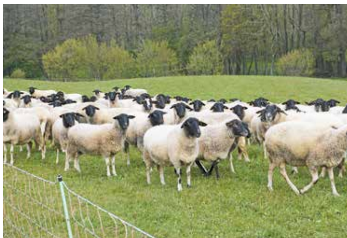
Damit Schafe auf der Weide sicher sind, braucht es einen gewissen Grundschutz. Dieser kann mit Zäunen und wahlweise auch Herdenschutzhunden sichergestellt werden.