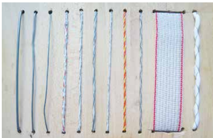
Mit qualitativ hochwertigem Leitermaterial lässt sich die notwendige Spannung auf dem Elektrozaun erreichen.

nungsprüfung ab einem Mindestalter von 18 Monaten ablegen und bestehen. Erst nach der bestandenen Prüfung kann die Tagespauschale gezahlt und können die laufenden Betriebskosten gefördert werden. „Einfacher ist der Kauf eines fertig ausgebildeten Herdenschutz Hundes, doch diese sind rar“, gibt Scharf zu bedenken. „Deshalb werden aktuell eher Welpen angeschafft.“